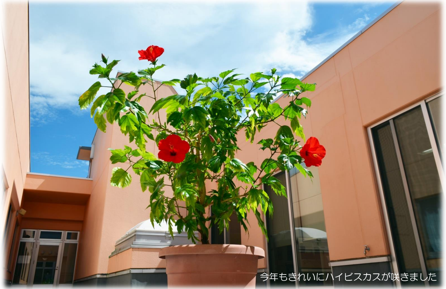
今年もきれいにハイビスカスが咲きました