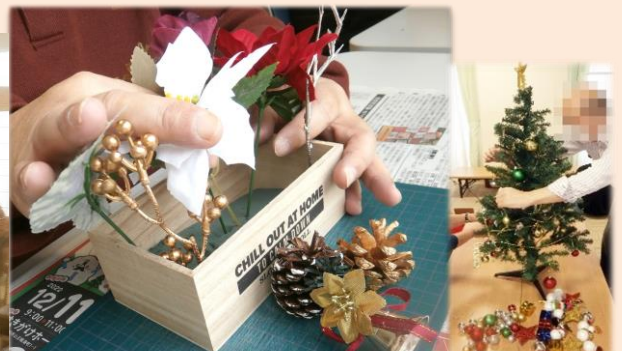
クリスマスパーティ

年末の大イベント『クリスマスパーティ』を開催しました。イベント前に電飾やモールで室内を飾り、クリスマス風のフラワーアレンジメントなどで雰囲気を徐々に高めていきました。パーティはクラッカーを鳴らして盛大にスタートし、クリスマスケーキやお楽しみ抽選会などを楽しんで頂きました。