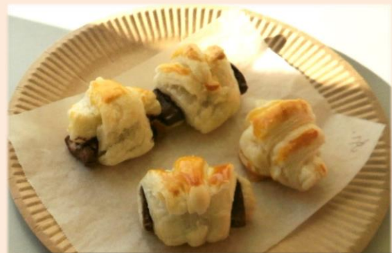
クッキングクラブ

焼き芋は秋の恒例プログラムです。今年もホクホク甘～い焼き芋が出来上がりました。芋の隣では焼き鳥を焼いて、BBQの雰囲気も楽しみました。