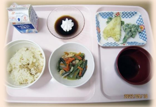
《ポリフェノールたっぷり 山菜御膳》

5月18日に山菜御膳として筍ご飯にたららの芽の天ぷら、わらびのお浸しを提供しました。毎年この季節になると旬の山菜を献立に取り入れており、患者さんに大変好評いただいています。山菜には独特な苦みやえぐみがありますが、その成分の正体はポリフェノールです。ポリフェノールには抗酸化作用があり、動脈硬化や生活習慣病の予防にも効果的です。ただし食べ過ぎはかえって身体に悪く、腸の働きも悪くするため春の味覚を楽しむ程度に少しずつ食べるようにしましょう。