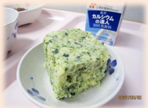
《虫歯予防メニュー》

6月3日に(本来であれば6月4日ですが休日のため)、虫(6・4)歯予防メニューとしてデザートに手作りのほうれん草チーズ蒸しパンを提供しました。虫歯のない丈夫な歯を作るためにはカルシウム・タンパク質・ビタミンを摂ることが重要です。カルシウムは牛乳やチーズやヨーグルト、ひじきなどに、タンパク質は肉や魚、牛乳、大豆、卵など、ビタミンはかぼちゃやほうれん草などの野菜や果物に豊富に入っています。こういった食材をバランス良く摂るようにしましょう。また、よく噛んで食べることも歯を丈夫にしさらには食べ過ぎ防止にもなります。日頃の歯磨きなども重要ですがバランスの良い食事をよく噛んで食べるよう心がけ、丈夫で健康な歯を保ちましょう。