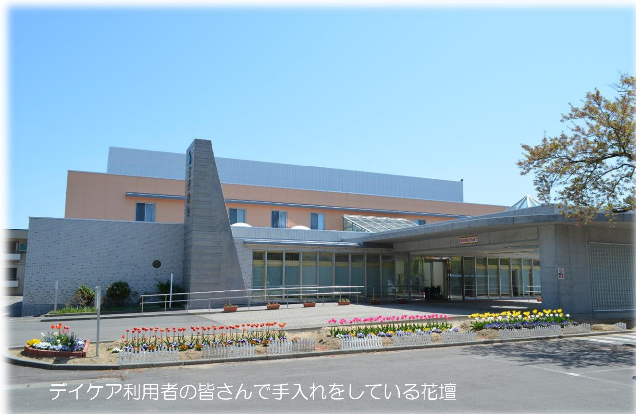
デイケア利用者の皆さんで手入れをしている花壇