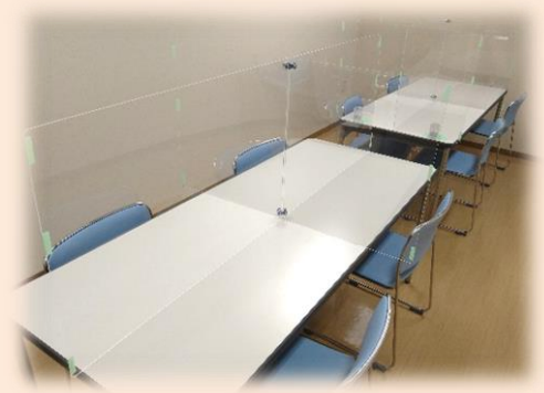
飛沫防止パーティションで 休憩中も感染防止