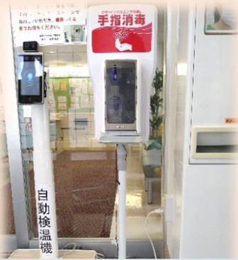
オートディスペンサーで 手指消毒