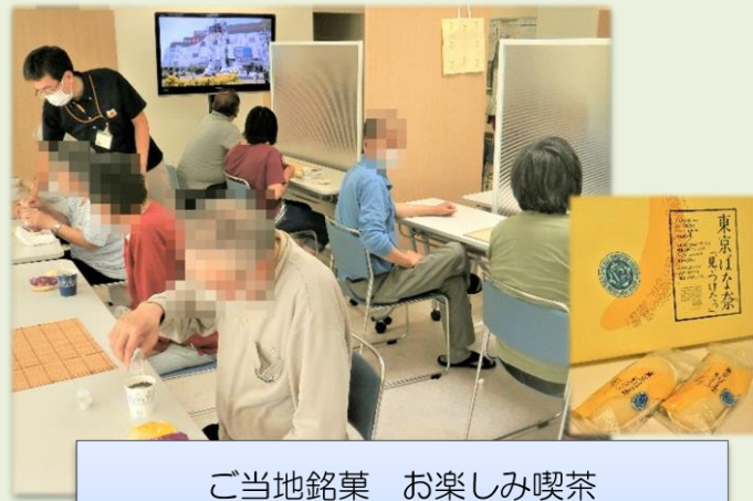
ご当地銘菓 お楽しみ喫茶

旬の夏野菜をふんだんに使い、調理実習を行いました。野菜を手軽に取り入れられるサラダやご飯に合う炒め物など、生活に応用できるメニューを練習しました。