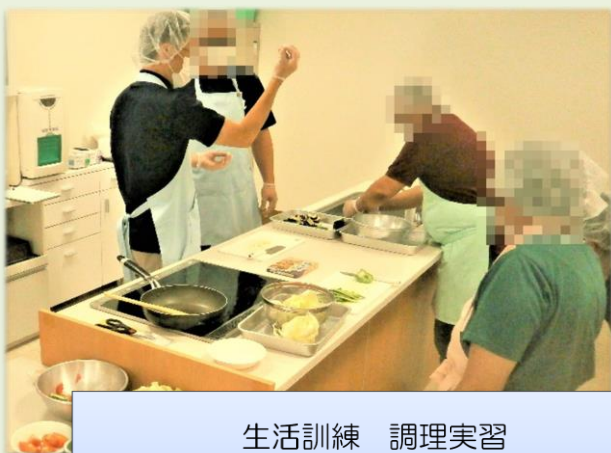
生活訓練 調理実習

プラ板にイラストを描いて熱で圧縮し、レジンやラメなどでデコレーション施します。完成した作品は、手作りなことを驚かれるほど精巧に仕上がります。