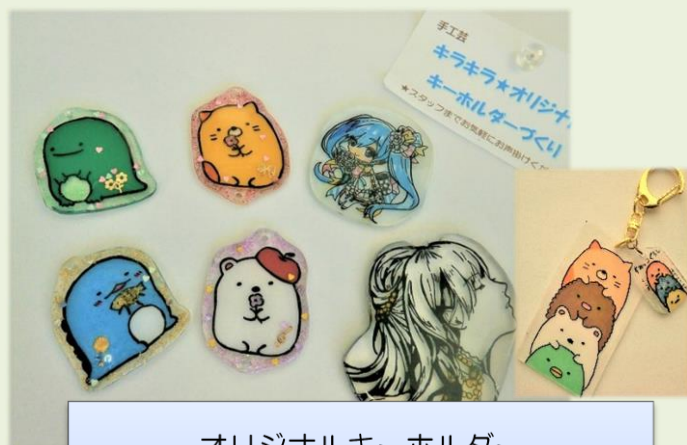
オリジナルキーホルダー

昔ながらの竹ひごと和紙で作る飛行機を作りました。上手く飛ばすには羽の角度や重心などの微調整が必要です。飛行機が風に乗って颯爽と飛び立つと歓声が沸きました。