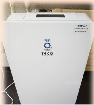
空気清浄機能付きオゾン発生器で 空気中のウイルスを除菌

当院では、全職員が一丸となって新型コロナウイルス感染防止の様々な取り組みを行っています。その取り組みの一部をご紹介します。