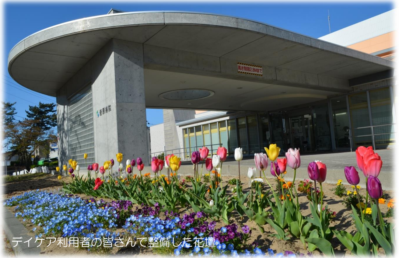
デイケア利用者の皆さんで整備した花壇