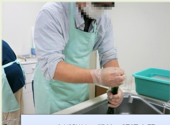
生活訓練 野菜の調理実習

不足しがちな野菜を多く取り入れ、食事バランス改善のための調理実習を行いました。野菜の茹で方や具だくさんみそ汁の調理など、簡単に生活に取り入れやすいメニューを体験しました。