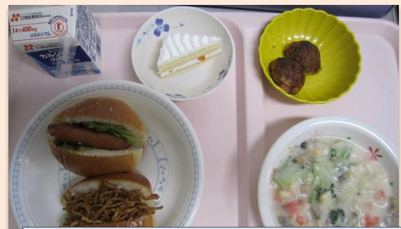
レクリエーション大会

11月5日に『秋の収穫膳』として、栗御飯、鮭の紅葉焼き、きのこの炒め物、豚汁、焼き芋ロールケーキを提供し、秋の味覚を存分に味わっていただきました。色彩も豊かな献立になり、味覚だけでなく視覚からも秋を味わっていただけたと思います。