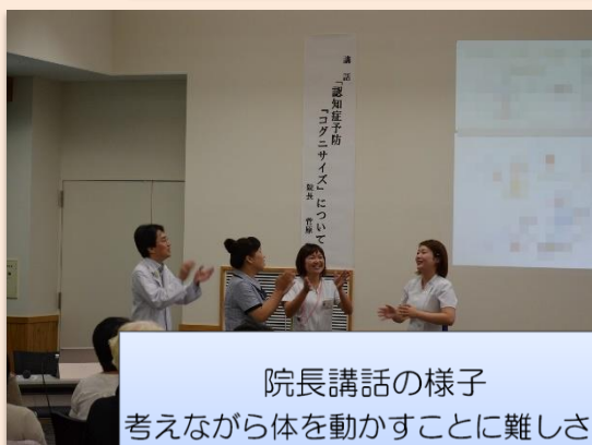
院長講話の様子 考えながら体を動かすことに難しさを感じながらも、皆様笑顔で楽しく体を動かしていました。