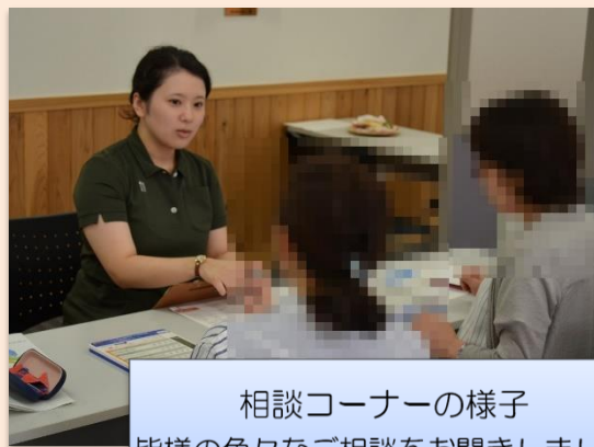
相談コーナーの様子 皆様の色々なご相談をお聞きしました。