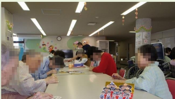
病棟ひな祭り会 レクリエーションとして、皆さん でつるし雛を作りました。