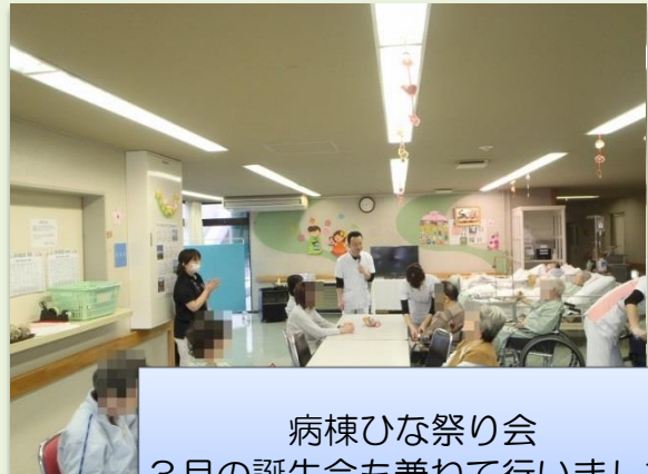
病棟ひな祭り会 3月の誕生会も兼ねて行いました。