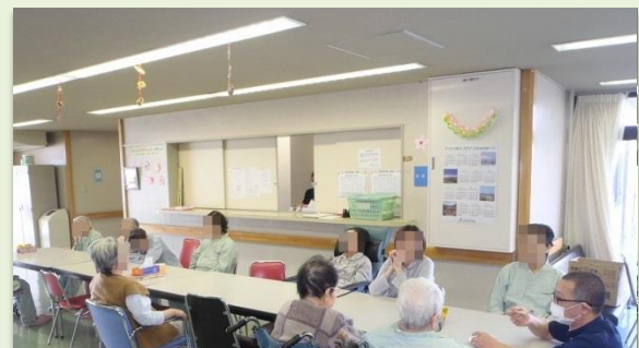
病棟ひな祭り会 ひな祭りの由来などの紹介を聞い たりして過ごしました。