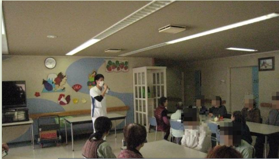
病棟新年会 食堂ホールでクイズやゲームを楽しみました。