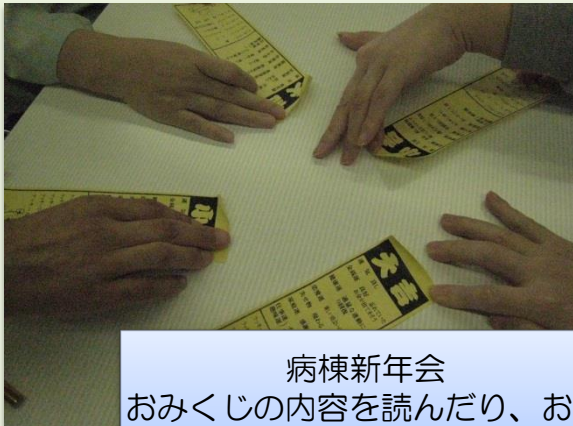
病棟新年会 おみくじの内容を読んだり、お互い に見せ合って楽しみました。