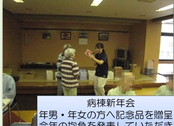
病棟新年会 年男・年女の方へ記念品を贈呈し 今年の抱負を発表していただきました。