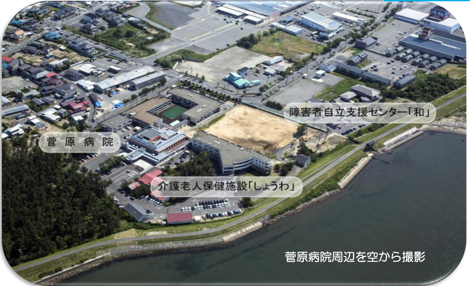
菅原病院周辺を空から撮影