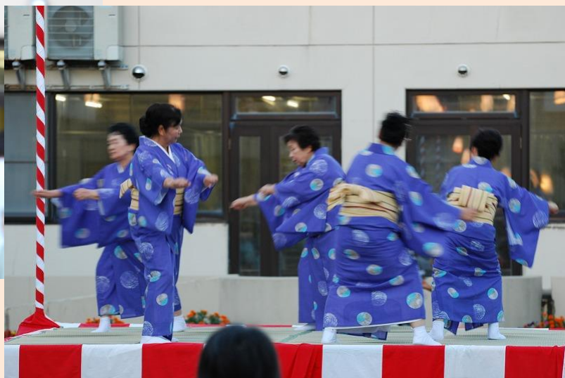
本荘民謡踊り同好会の皆様