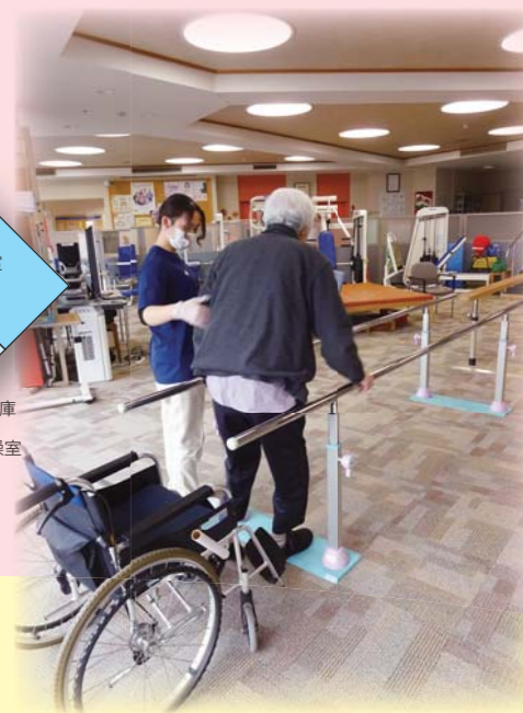
リハビリテーション(歩行訓練)