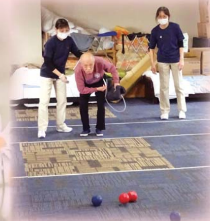
レクリエーション(ポッチャ)