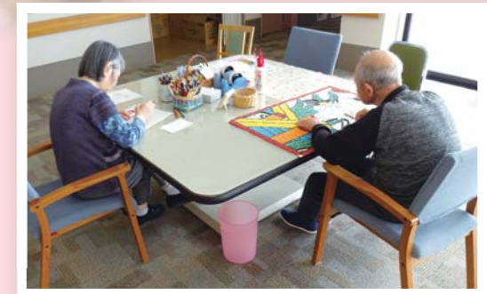
リハビリテーション(作業活動)